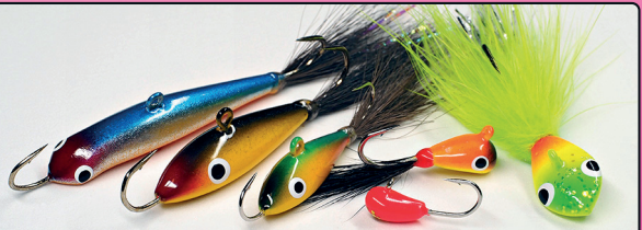
MA-Muikku, Mutu3ja2, Kilpa, Micro-Mutu, Mutu-leech

HYVIN VARUSTETUISTA KALASTUSTARVIKELIikkeistä